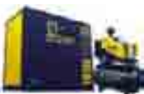
Compressores de parafuso

SE O SEU AR COMPRIMIDO CONTIVER MUITA UMIDADE NA FORMA LÍQUIDA, UTILIZE UM FILTRO COALESCENTE ANTES DO AIR POINT