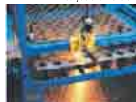
Corte a plasma