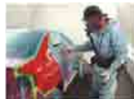
Pintura de alto padrão